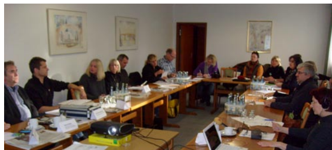
Volles Haus bei unserer Pressekonferenz zum ersten Strafverfahren zum Schächten in Buxtehude.

Diesem Motto hat sich die Erna-Graff-Stiftung mit ihren Projekten seit mehreren Jahren verschrieben und bietet mit dem umfangreichen Schulprojekt Walk the dog! – Das Schulprojekt zu Mensch und Tier Unterrichtsmaterial zum Tierschutz in verschiedenen Sprachen an. Künftig möchte die Stiftung getreu dem obigen Motto auch Journalisten und Interessierten Informationen rund um aktuelle tierschutzrelevante Ereignisse anbieten. Aktuell begleitet haben wir vor wenigen Tagen das bundesweit